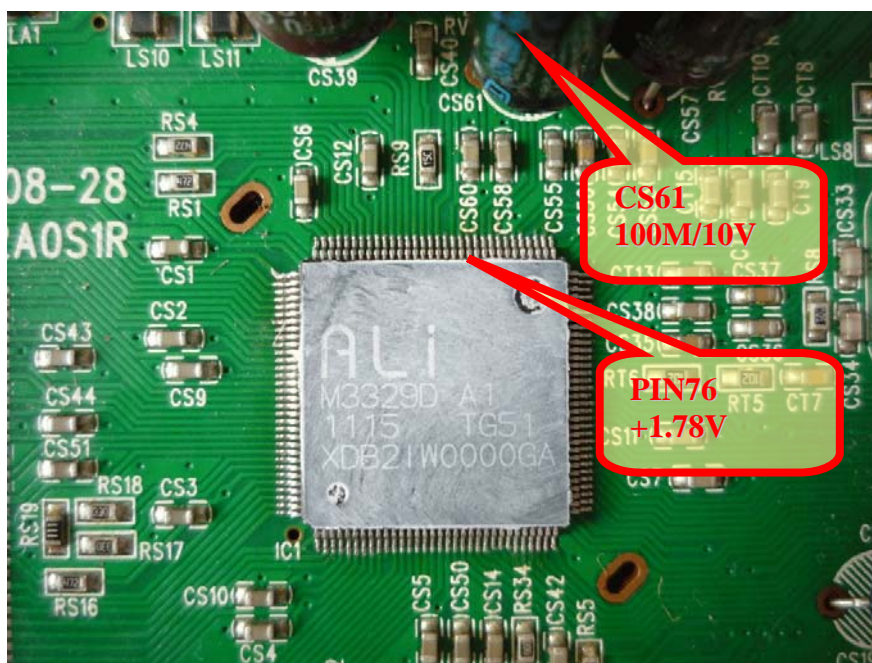
Detail ALI M3329D s pozíciou pre PIN76